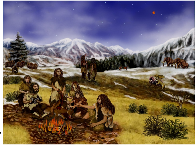
イメージ図:人類の誕生した時代(先史時代)

さらに時を経て、約4万年前になると我々の祖先にあたる(12) _____ が誕生する。ヨーロッパの(13) _____ や中国の(14) _____ などが代表例である。彼は(15) _____ を用いて生活をより豊かにし、すぐれた(16) _____ を残した。