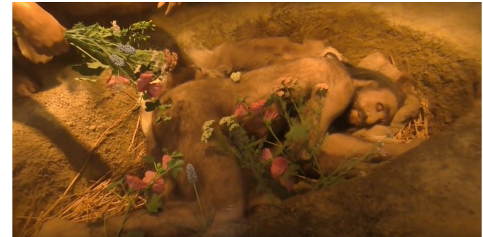
図:埋没される旧人